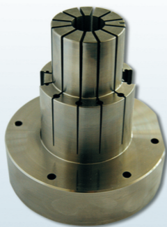
Wydrukowana wkładka formująca z chłodzeniem konformalnym

część ilości produkowanych detali. FADO kieruje swoją ofertą również do klientów szukających obniżenia kosztów produkcji oraz poprawienia jakości poprzez wyeliminowanie deformacji skurczowych. Zastosowanie chłodzenia konformalnego pozwala na redukcję czasu cyklu nawet o 30%, a równomierny rozkład temperatur gwarantuje mniejsze odkształcenia wypraski. FADO dysponuje także zestawem nowoczesnych oprogramowań, które umożliwiają